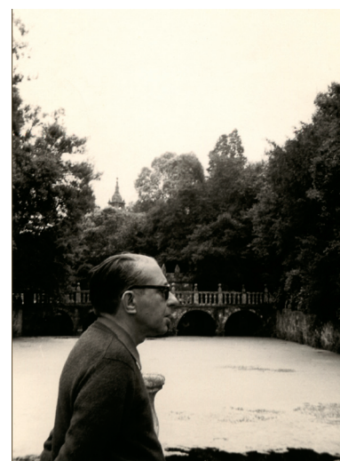
Gonzalo Torrente Ballester no Pazo de Oca (Fundación GTB)