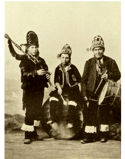
Músicos galegos (Annette M. B. Meakin: Galicia the Switzerland of Spain . Londres, 1909)