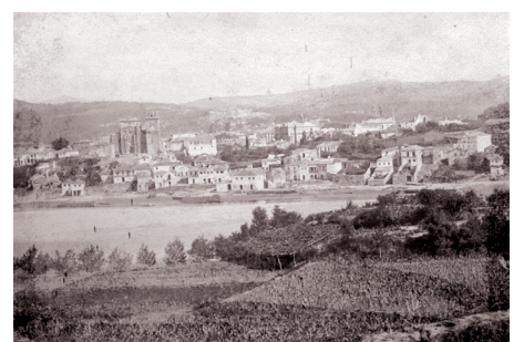
Vista xeral de Pontevedra ca. 1883 (Museo de Pontevedra)