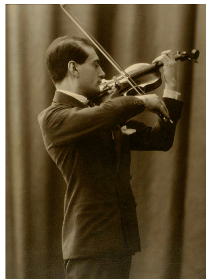
Manuel Quiroga (J. Pintos, ca. 1919) (Museo de Pontevedra)