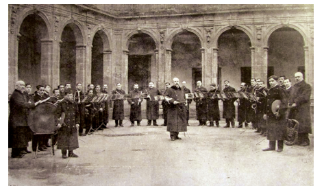
A Banda Municipal de Música de Santiago de Compostela ( Vida Gallega , 1909)